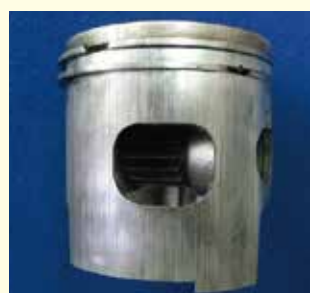
オイル不良 ピストンの異常磨耗 (全周に縦キズあり)