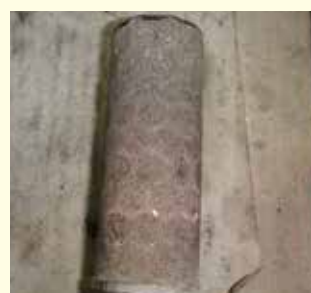
真空ポンプストレーナー ゴミ詰まりによる吸水不能